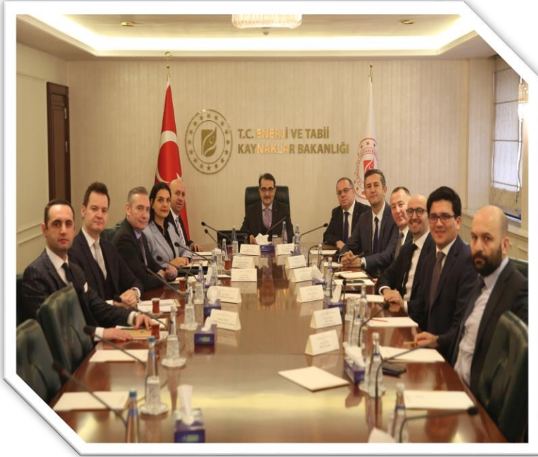
Enerji ve Tabii Kaynaklar Bakanı Sn. Fatih Dönmez Ziyareti

Sn. Murat Kalay başkanlığındaki Yönetim Kurulu tarafından 9 adet resmi ziyaret gerçekleştirilmiştir.