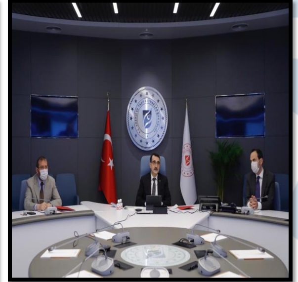
Enerji Sektörü-Sn. Fatih Dönmez Webinarı