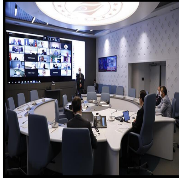
TOBB Enerji Meclisi- Sn. Fatih Dönmez Webinarı