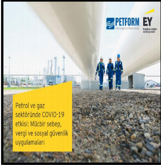
PETFORM-EY Turkey Webinarı