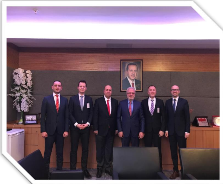
TBMM Enerji Komisyonu Başkanı Sn. Mustafa Elitaş Ziyareti