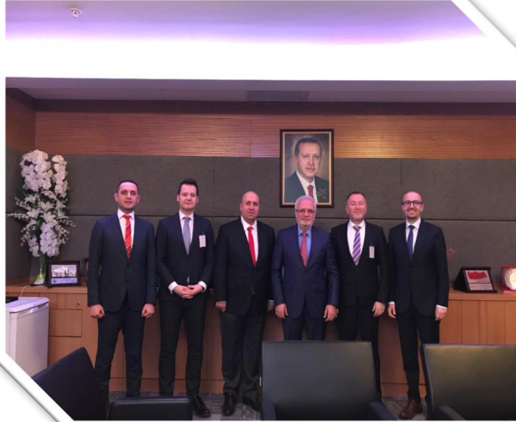
Chairman of the Energy Commission of TGNA Mr. Mustafa Elitaş Visit