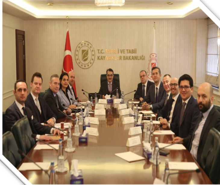
Minister of Energy and Natural Resources Mr. Fatih Dönmez Visit

9 official visits were made by the Board of Directors.