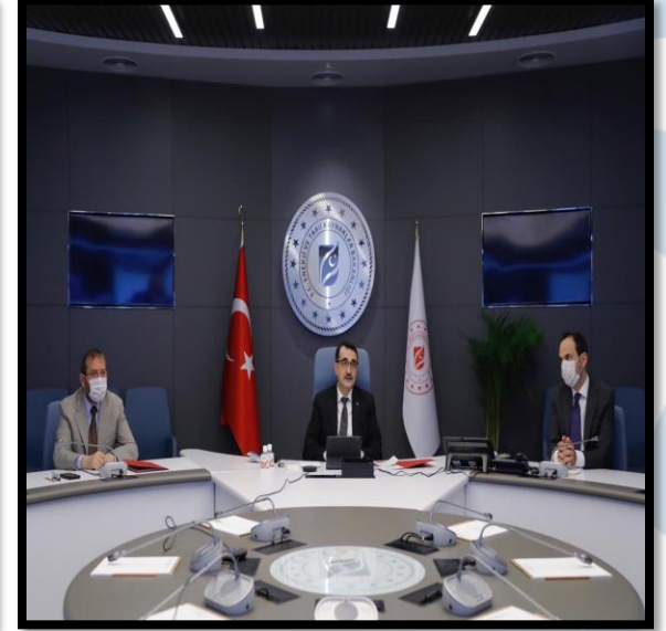
Energy Sector-Mr. Fatih Dönmez Webinar