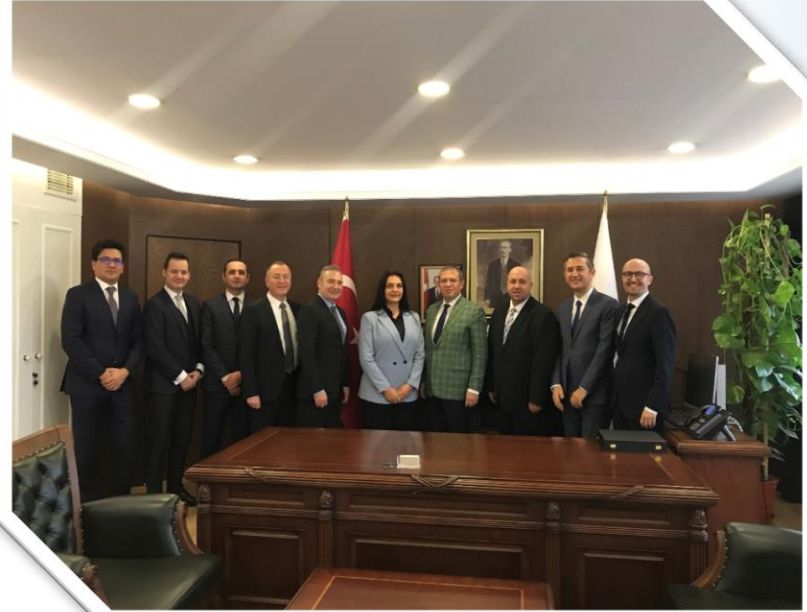
Deputy Minister of Energy and Natural Resources Abdullah Tancan Visit